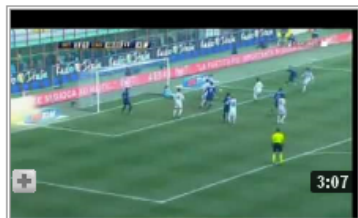
Video gol highlights Inter Cagliari 3-0 - 23a gio... 觀看次數：13,260 DJPUPATORINO ★★★★☆