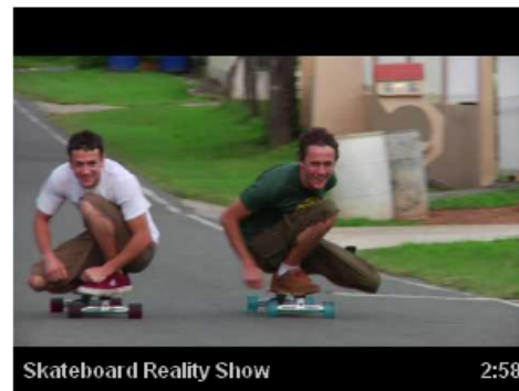
Skateboard Reality Show 2:58

Skateboarding + Travel + Drama? If you like Laguna, Watch this. Originalskateboards 2,523,491 views Promoted Video